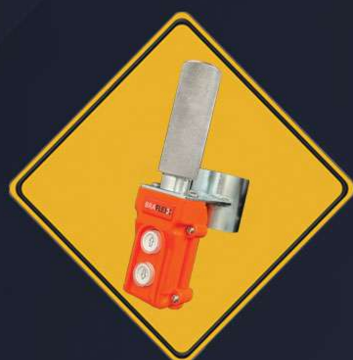
Controle remoto com fio