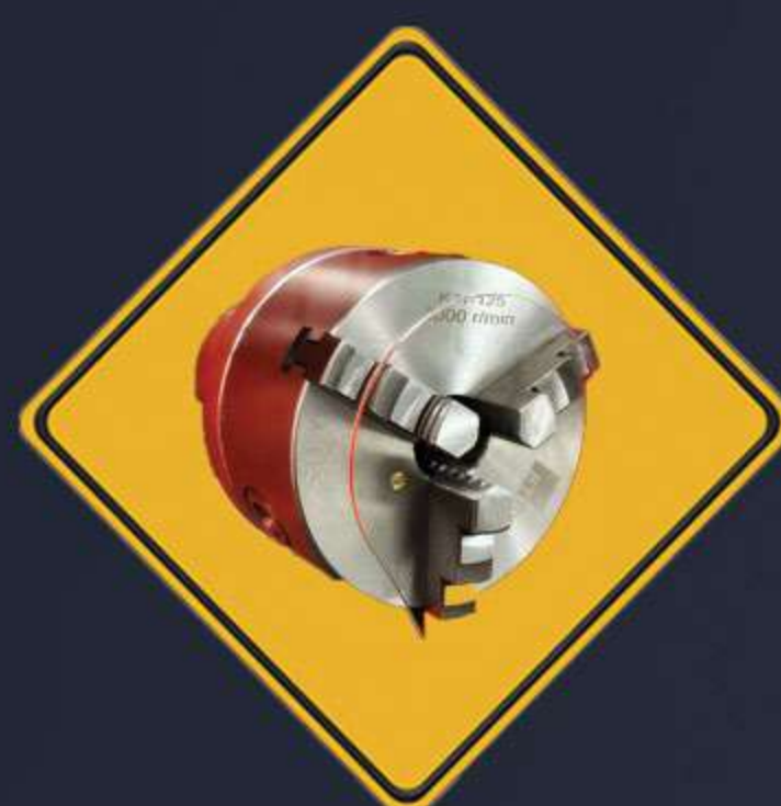
Opcional enrolador de protecao de mangueira