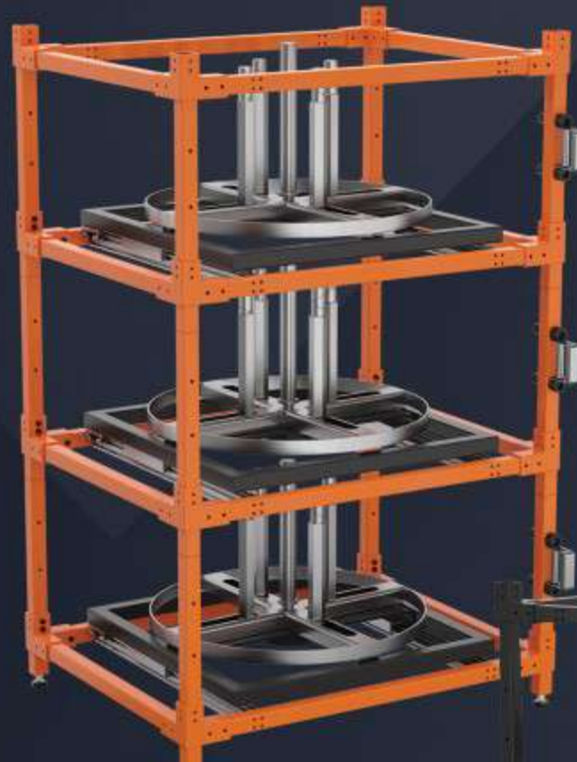
NICHO MODULAR PARA MANGUEIRAS