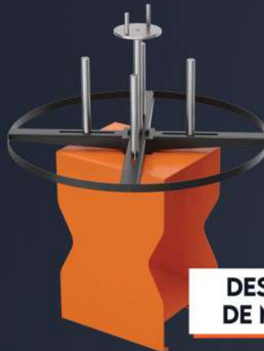
DESBOBINADOR DE MANGUEIRAS