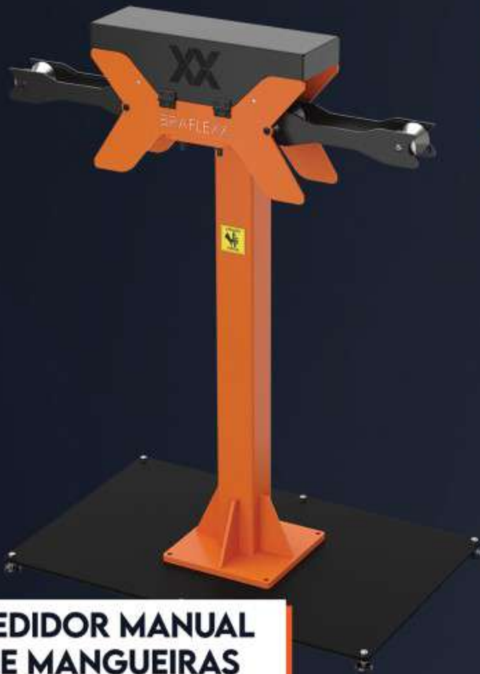
MEDIDOR MANUAL DE MANGUEIRAS

PARA CENTROS DE MONTAGENS DE MANGUEIRAS HIDRÁULICAS